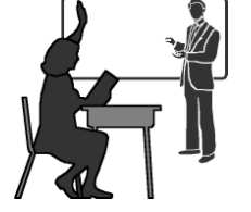
एक चांगला शिक्षक

येशुचे तीन दाखले आपल्यासारख्या पापी लोकांची तुलना करतात ज्या हरविल्या होत्या व त्या पुनः आनंदाने सापडल्या . २ या तीन्ही दाखल्यांचा अर्थ अगदी सरळ आहे . स्वर्गामध्ये आनंद व उल्हास होतो जेव्हा हरवलेले पापी लोक देवाकडे “घरी” परततात .