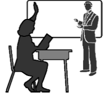
ஒரு நல்ல ஆசிரியர்

இயேசு கூறிய உவமைகளில் மூன்று, நம்மைப்போன்ற பாவம் நிறைந்த மனிதர்களுடன், மீண்டும் சந்தோஷத்துடன் கிடைக்கப்பெற்ற காணாமற்போன பொருள்களுக்கு ஒப்பிடப்படுகின்றன. இம்மூன்று உவமைகளிலிருந்தும் கற்றுக்கொள்ளும் பாடம் தெளிவானது. அது என்னவெனில் தொலைந்துபோன பாவிக்க கடவுளின் வீட்டை வந்தடையும்போது மோட்சத்தில் சந்தோஷமுண்டாயிருக்கும் என்பதே.