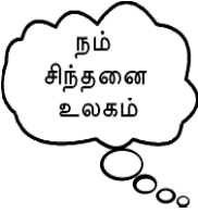
எதிரிகளிடம் அன்பு செலுத்துதல்